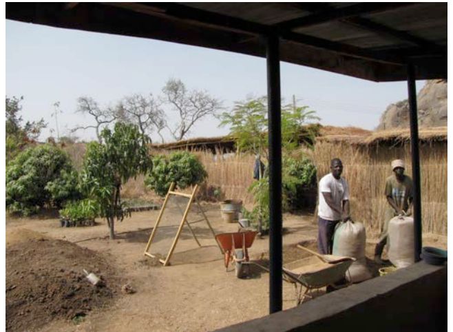
Pépinière de l'Institut APLORI