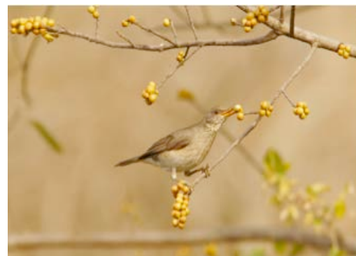
Turdus pelios et Cinnycinclus leucogaster mangeant des figes d'un Ficus thonningii