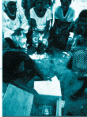
Réunion de micro-crédit à Akassa.